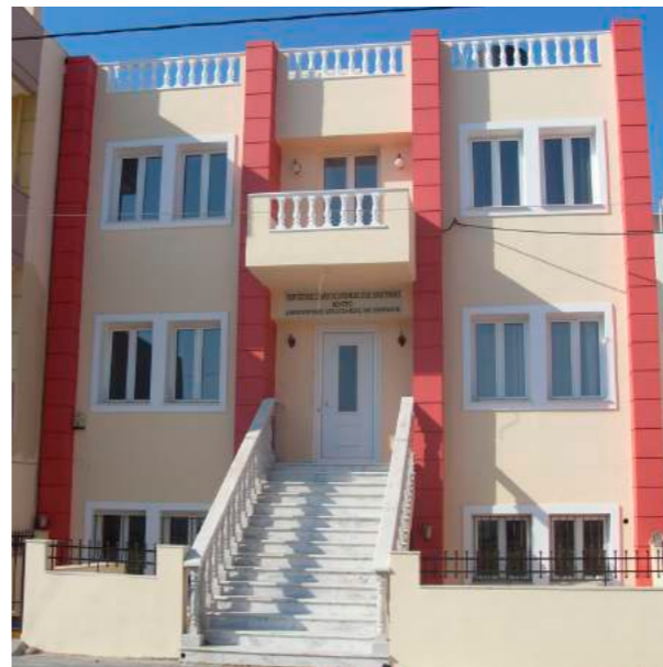
ΚΕΝΤΡΟ ΔΗΜΙΟΥΡΓΙΚΗΣ ΑΠΑΣΧΟΛΗΣΗΣ ΚΑΙ ΕΚΦΡΑΣΗΣ ΠΟΛΙΤΙΣΤΙΚΟΥ ΣΥΛΛΟΓΟΥ ΑΓΙΑΣ ΑΙΚΑΤΕΡΙΝΗΣ (ΝΕΟ ΙΔΙΟΚΤΗΤΟ ΚΤΙΡΙΟ)

ΟΙ ΕΚΔΗΛΩΣΕΙΣ ΚΑΘΗΜΕΡΙΝΑ ΘΑ ΠΡΑΓΜΑΤΟΠΟΙΟΥΝΤΑΙ ΣΥΜΦΩΝΑ ΜΕ ΤΟ ΠΡΟΓΡΑΜΜΑ, ΣΤΟ ΠΑΡΚΟ ΜΠΡΟΣΤΑ ΣΤΗΝ ΕΚΚΛΗΣΙΑ ΤΗΣ ΑΓΙΑΣ ΑΙΚΑΤΕΡΙΝΗΣ. ΩΡΑ ΕΝΑΡΣΗΣ 9μ.μ. Η ΕΙΣΟΔΟΣ ΕΙΝΑΙ ΕΛΕΥΘΕΡΗ. ΠΑΡΑΚΑΛΟΥΜΕ ΝΑ ΕΙΣΤΕ ΣΥΝΕΠΕΙΣ ΣΤΗΝ ΩΡΑ ΕΝΑΡΣΗΣ ΤΩΝ ΕΚΔΗΛΩΣΕΩΝ.